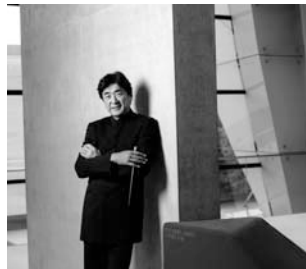
コンサート

開演日時 3/27 (日) ①11:00 ②14:30 会場 本多の森ホール 会員料金 1,800円 (通常2,700円) 予約受付開始 1/7 (木) 17:00~ 3歳以上有料、2歳以下は保護者1名につき1名以上鑑賞可、ただしお席が必要なお子様は有料